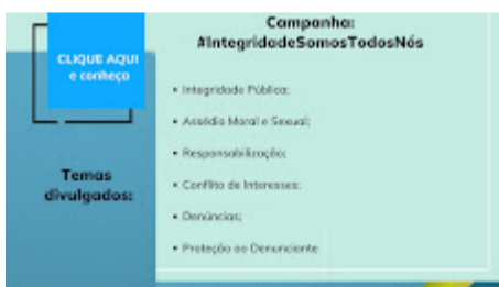
Apresentação Verde e Branca de Conferência Agro (1).jpg 152K