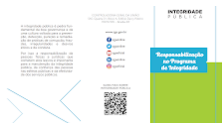
Imagem folder.png 195K