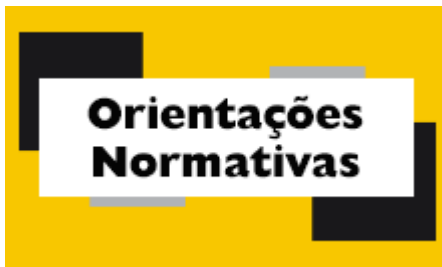
orientaes normativas.png 5K